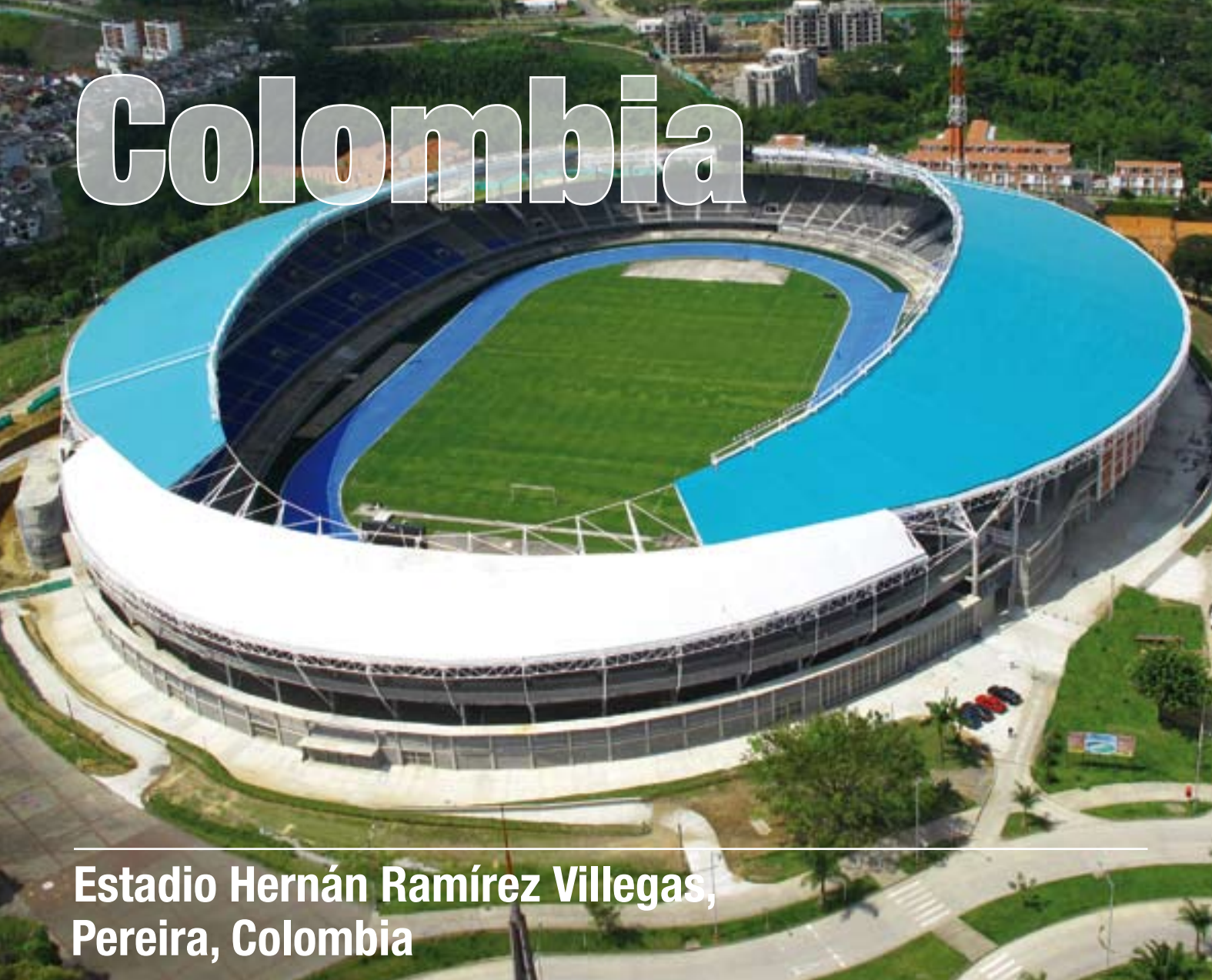
Estadio Hernán Ramírez Villegas, Pereira, Colombia