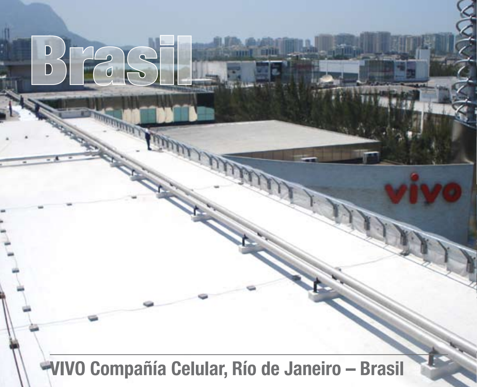
VIVO Compañía Celular, Río de Janeiro – Brasil